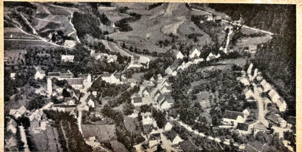
⊕ Betzweiler Photo: Luftverkehr Strähle Nr. 15 999. Freigeg. d. R.L.W.

Verläng: C: Station ist Alpirsbach (8 km) der Strecke Freudenstadt—Schiltach—Hausach. Streck: über Nr. 306. Ausft: Bürgermeister. Günstiger Stützpunkt zur Erwanderung des Ostrandes des Schwarzwaldes, Höhenweg III nach Schramberg oder Freudenstadt; nach Loßburg, bekannt durch die Trachtengruppe mit Trachtenmusik bei festlichen Anlässen; nach Alpirsbach im Kinzigtal; ins Redartal. Unterft: Gute Gasthöfe.