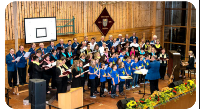
Foto: Konzert 2015 - Abschlusschor mit Männergesangverein, Kinderchor und Projektchor.