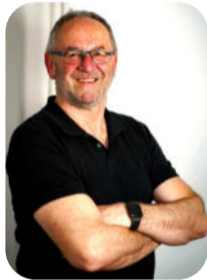
Ortsvorsteher Betzweiler- Wäldern

Liebe Leserinnen und Leser dieser Festzeitschrift,